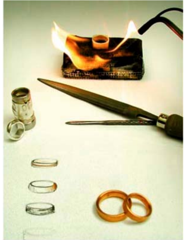
Katrin Arp . Schmuckgestaltung

in zeitgemässer Gestaltung entwickelt und angefertigt.